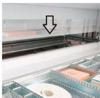
PORTA DI CHIUSURA