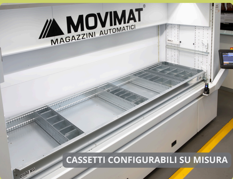
CASSETTI CONFIGURABILI SU MISURA