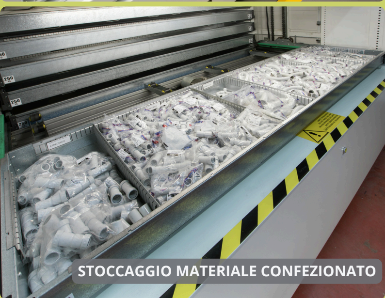
STOCCAGGIO MATERIALE CONFEZIONATO