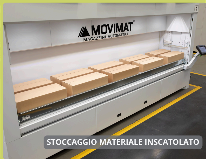
STOCCAGGIO MATERIALE INSCATOLATO