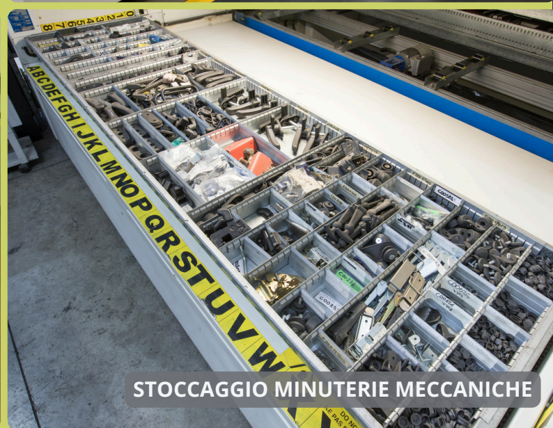
STOCCAGGIO MINUTERIE MECCANICHE