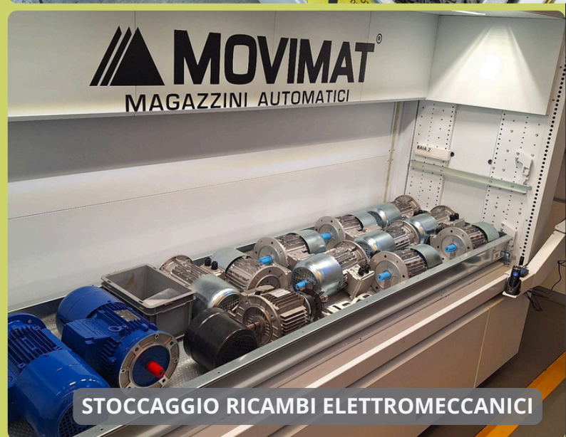
STOCCAGGIO RICAMBI ELETTROMECCANICI